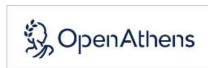
↑ OpenAthens バナー

ブラウザに以下の URL を直接入力または QR コード読み取りでの利用も可能です。